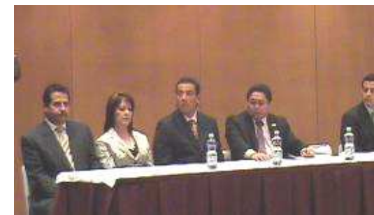
Mesa de Honor

En este Construlag sirvió de marco para realizar trabajos y tener una serie de