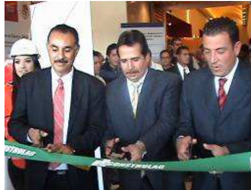
Corte del listón de la Expo.