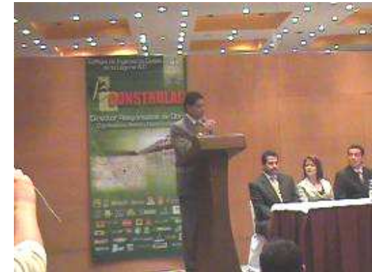
Gobernador C.P. Jorge herrera Caldera